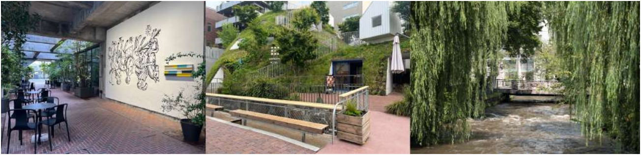
（左）白井屋ホテルパサージュ（中）白井屋ホテル馬場川通り側ベンチ（右）広瀬川